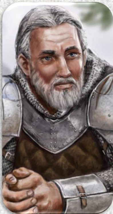
Aktuálně: Dareon Andaryon